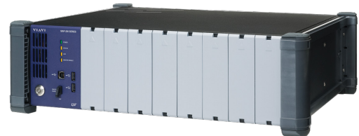
图 2b. 对于用户需要访问所测试的设备、MAP-200 模块和 GUI 的应用，将 MAP-200KD 配置为放在 MAP-280 旁边是最佳方式。