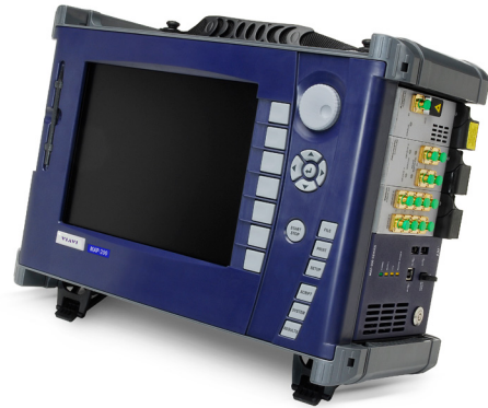
图 2a. 对于用户经常需要访问 GUI 的应用，将 MAP-200KD 安装在 MAP-230 上是最佳配置。

如图 2a 所示，MAP-230 主机可与安装在其上方的 MAP-200KD 模块配合使用。主机上的弹出式支脚使用户能以面向前方的方式放置主机，以获得最佳观看和交互效果。