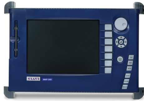
图 1. 键盘/显示模块

具有图形用户界面 (GUI)，并且 MAP-200 主机的本地控制采用标准通用串行总线 (USB) 键盘、USB 鼠标和数字视频接口 (DVI) 显示器。如图 1 所示，Viavi 为本地控制功能提供了可选的特定用途键盘/显示模块 (MAP-200KD)，便携性和灵活性进一步增强。MAP-200KD 具有滚轮、七个软键、五个导航按钮以及七个用于在 GUI 中导航的预分配按钮。触控功能和用户友好的控制器是标准配置，只需用手指或提供的触笔轻触便可完成操作。MAP-200KD 模块的背面有一个行业标准安装端口，与商用显示底座或特定用途 MAP-200 键盘显示 19 英寸机架安装套件 (MAP-200A09) 兼容。或者，用户也可使用 PC 通过虚拟网络连接 (VNC) 客户端来访问 GUI。