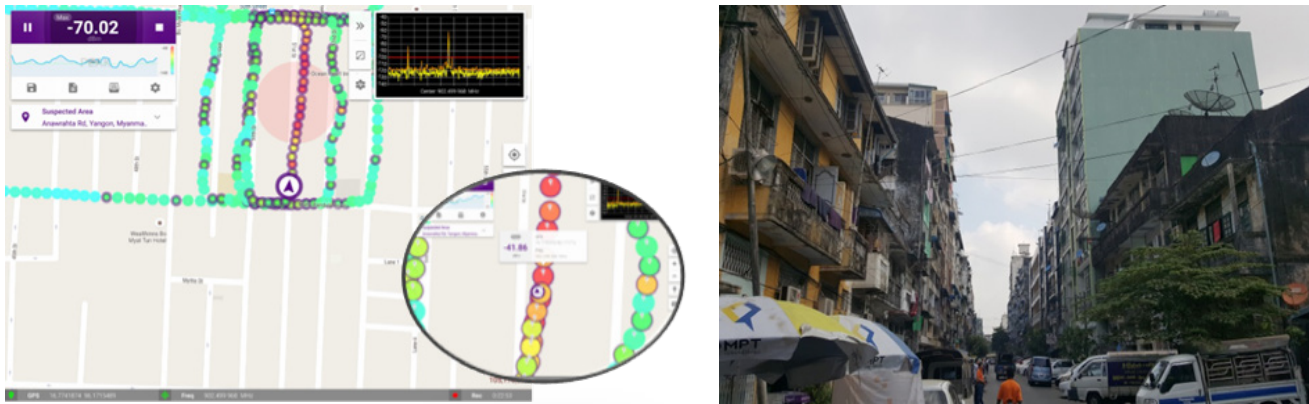
Der InterferenceAdvisor führt den Techniker zum wahrscheinlichen Standort des Störers

In diesem konkreten Fall handelte es sich um mehrere Wohnhochhäuser. Alle Straßen zwischen diesen Gebäuden mussten kontrolliert werden, um den wahrscheinlichsten Ausbreitungspfad und den Standort des Störers zu ermitteln.