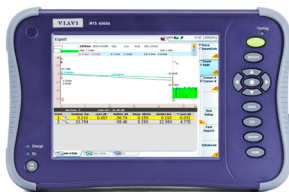
Plateforme multicouche compacte pour l'installation et la maintenance de réseaux