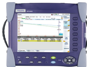
Plateforme évolutive pour tests multicouches et à protocoles multiples