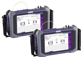
专为有线和无线网络的安装和维护而设计的模块化测试平台