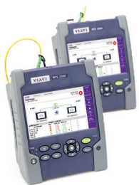
用于光纤网络测试的单槽位手持式模块化平台