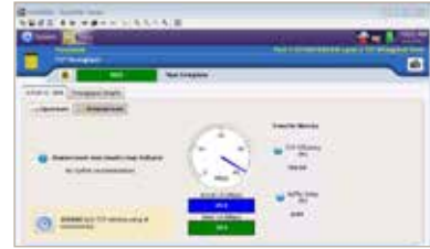
RFC6349 準拠の Fusion TrueSpeed VNF