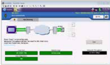
J-QuickCheck 機能付きの拡張 RFC 2544 テスト