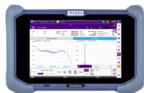
OneAdvisor 800 一體化有線和無線網路安裝和維護測試解決方案