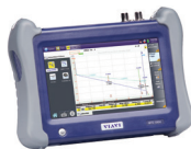
MTS-5800 用於測試 10G 乙太網路和光纖網路的手持式測試儀器