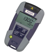
Fuente de luz óptica