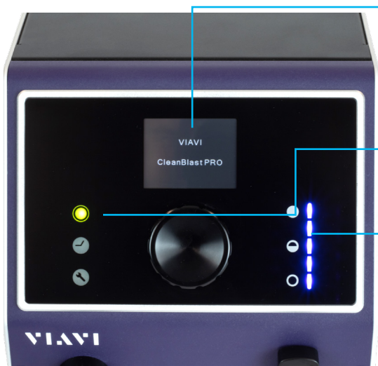
Figura 3: Controles e indicadores del panel delantero

Los controles de la solución CleanBlastPRO son intuitivos para que los usuarios puedan gestionar fácilmente sus perfiles de limpieza, y reciban información y notificaciones para garantizar el cuidado del sistema. El sistema CleanBlastPRO, que cuenta con varios sensores integrados, monitoriza de forma activa el rendimiento del sistema para garantizar que los usuarios estén informados de manera proactiva de todas las necesidades de mantenimiento, de modo que puedan cuidar correctamente del sistema y elaborar una planificación anticipada sin conjeturas, especulaciones ni interrupciones imprevistas en la línea de producción.