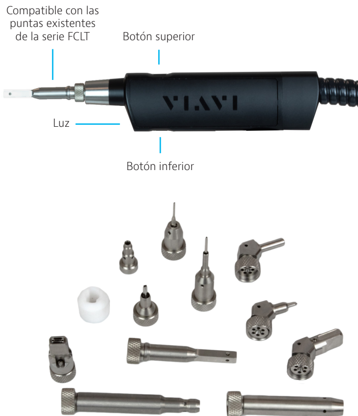
Figura 2: Ejemplos de puntas de limpieza de la serie FCLT