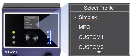
Figura 1a: Selección de perfil