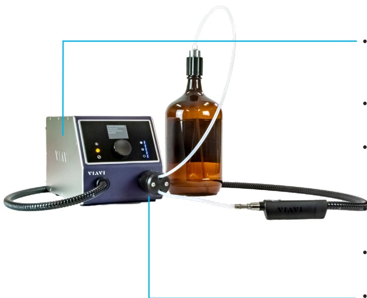
Figura 4: Llenado de disolvente