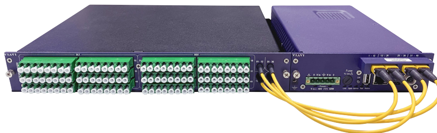
FTH-5000 con un punto de acceso de pruebas (TAP) de 48 puertos y un conmutador MPO de 48 puertos