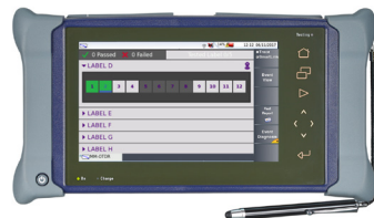
Plataforma modular portátil de dos ranuras MTS-4000 V2 para pruebas de redes de fibra óptica