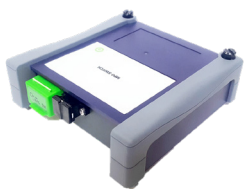
Módulo de conmutación basado en conectores MPO multifibra de 12 puertos

Solucione problemas con solo pulsar un botón. Acelere la localización de fallas de la fibra óptica con una búsqueda precisa de los problemas, como las curvaturas acusadas, los empalmes con pérdidas elevadas, y las conexiones sucias o de poca calidad.