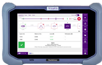
Plataforma de pruebas modular OneAdvisor 800 con tres ranuras diseñada para su uso en la instalación y el mantenimiento de aplicaciones de transporte, inalámbricas y de fibra óptica.