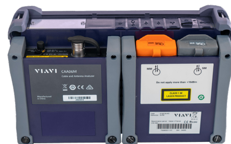
OneAdvisor 800 の CAA06M