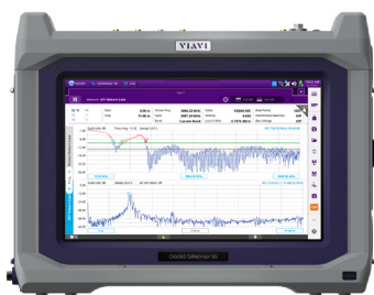
CA5000 CellAdvisor 5G