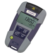
Fonte de luz óptica