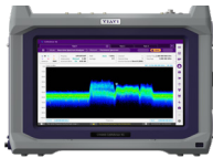
CellAdvisor 5G 基站測試解決方案