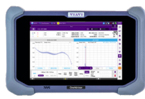
OneAdvisor-800 一體化基站安裝和維護測試解決方案