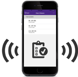
在有新任务分配给您时收到通知