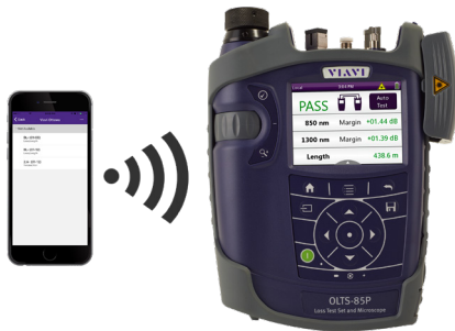
通过无线连接将特定测试部署到现场仪器