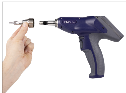
轻松连接到 INX 760