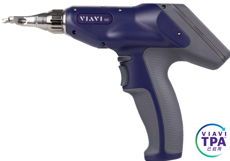
INX 760 探针显微镜

虽然光纤端面检测已经成为许多现场技术人员的标准做法，但污染仍然是光纤网络问题的头号原因。随着新型连接器的出现、现场连接器用量的增加以及新光纤技术人员的增加，该行业已经到了一个转折点，因此需要一种新的检测解决方案 - INX 760。