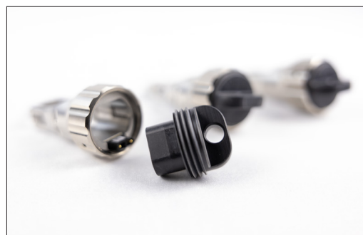
每个端子都配备了 AutoID 技术