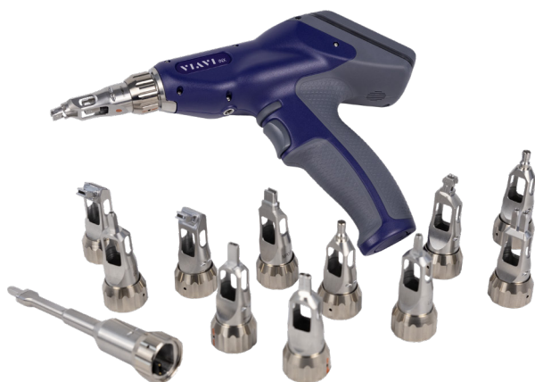
适用于单纤、双工和多纤连接器的端子