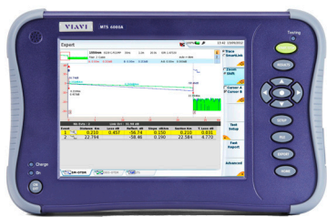
用于网络安装和维护的紧凑型多层平台