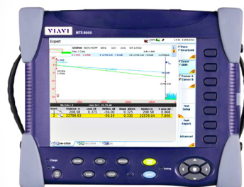
用于多网络层和多协议测试的可扩展平台