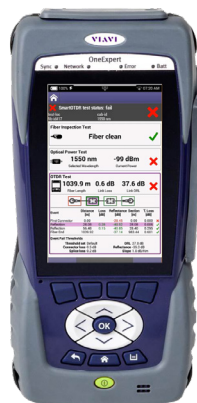
在 ONX 上查看 OneCheck Fiber 结果