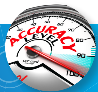
校准使得测量结果准确