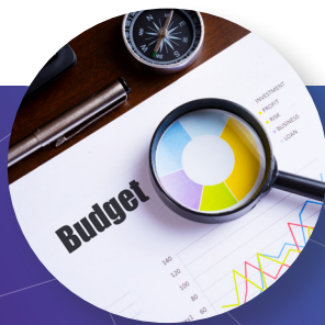
维护成本低且可预测

与您的测试设备一起购买服务计划，以便以尽可能最低的总拥有成本预算您长达 5 年的服务成本。使成本可预测，并减轻您的管理负担！计划通常可以预先资本化，获得良好的 ROI，因为它们的成本比被动按菜单购买低 65%。让您高枕无忧，因为您知道您的设备是最新的，并以最佳状态工作 — 并且，您的技术人员知道如何有效地使用他们的应用程序。